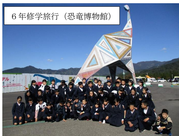
6年修学旅行(恐竜博物館)

各学年の校外での学習が、地域や保護者の方々に支えられて行うことができていることに感謝し、今後も子どもたちの健やかな成長に向けて、様々な教育活動を計画し、実施していきたいと考えています。