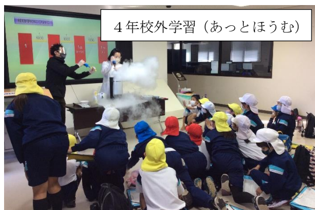
4年校外学習(あっとほうむ)