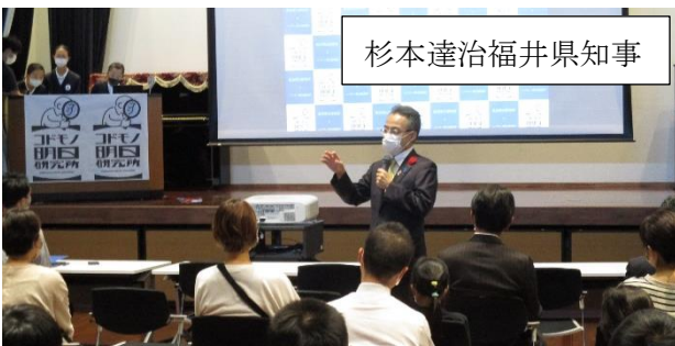
杉本達治福井県知事

発表後、杉本知事からは、「高浜への熱い思いが伝わってくる素晴らしい発表でした。ぜひムラサキウニの商品化に向けてがんばってほしい。」という激励を