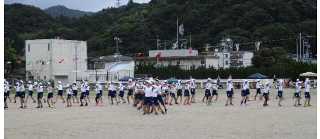
Rock de Dance!! -I want you back- (高学年)

大切なことは、心の持ち方、考え方です。「努力してきたことを自信にする」、「上手くいかなかったことを成功や次なる挑戦への土台とする」など、心の持ち方次第で前向きに歩いていけるはずです。