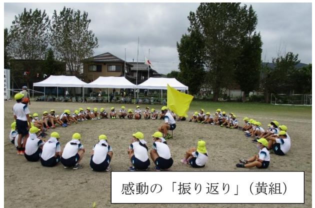
感動の「振り返り」(黄組)

子どもたちが、大会後の「振り返り」で表現（発表）したことは、まさに今後に向けての「前向きな心の持ち方」であったと思います。思い出として終わるだけの体育大会ではなく、次につながる、子どもたちの心の大きな成長を感じられる体育大会となりました。