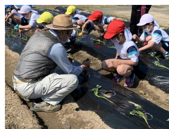
【サツマイモ苗植え(2年生)】

標準とされる総授業時数と比較すると、本年度実施予定の総授業時数との差がそれほどありません。しかしながら、例年は、標準とされる総授業時数を超えた授業を実施しています。そのために本年度は、各教科の指導方法の工夫をするとともに、行事の精選をしたり、木曜日の日課を工夫して45分間の学級裁量の時間を設定したりするなど、子どもたちの学習に大きな負担のかからないように落ち着いた丁寧な指導を行っています。また、心のケアを含め心身の健康にも留意し、子どもたちに寄り添う指導に努めていきますので、保護者の皆さまには、今後の本校の教育活動に対しまして、ご理解とご協力をお願いいたします。