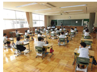
【1年生の教室(多目的ホール)】