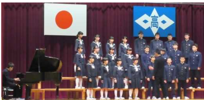
【最優秀賞の3年3組の合唱】

10月28日（土）に、大きな学校行事の一つである「高中祭」を盛大に開催することができました。多くの保護者や地域の方々にご来校いただき誠にありがとうございました。午前中は、合唱コンクール、午後は、ステージ発表や吹奏楽部の演奏、そして全校フォークダンスを行いました。合唱コンクールでは、どの学級も今までの練習の成果を発揮し、素晴らしい合唱を聴かせてくれました。その中で、3年3組の「手紙～拝啓15の君へ～」が見事最優秀を受賞しました。11月15日（水）に行われた郡音楽会では、3年3組の合唱と吹奏楽部の演奏を発表しました。その様子は、12月2日（土）・3日（日）の両日、午後1時よりチャンネルOで放送されますので是非ご覧ください。