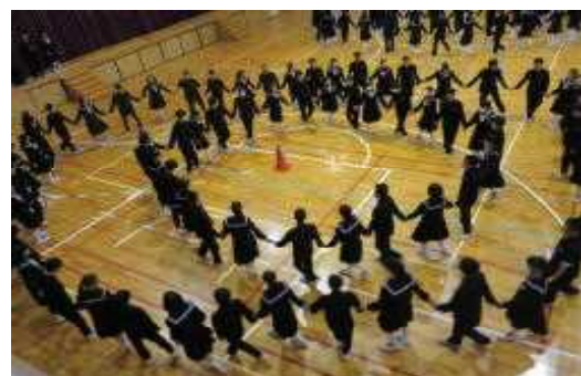
【全校フォークダンス】